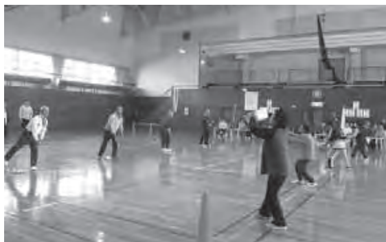
各競技で熱戦が繰り広げられました