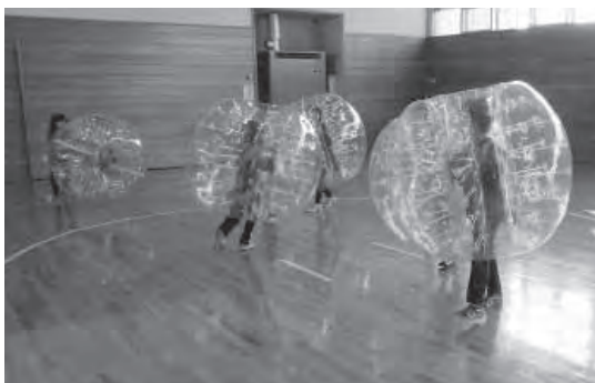
バブルボールを使った、新感覚の鬼ごっこ