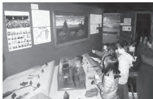
郷土学習の様子 少し苦戦しています

参加した児童は、まず郷土館でクイズ形式の問題を解きながら郷土学習を行い、続いてスポーツセンター厨房で、デザートプリン作りに挑戦しました。プリンは固まるまで時間がかかるので、まず昼食。その後は新スポーツの「バブルボール」で新感覚を体験しました。そしてお待ちかねのプリンを実食。とてもおいしくできました。