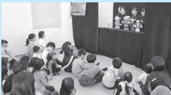
ぶちパンプキンによる人形劇

図書館では10月28日（土）に読書週間にちなんで、「絵本おはなし会」のスペシャル版を開催しました。この日は絵本の読み聞かせやパネルシアターの後、布遊具・布絵本製作サークル“ぶちパンプキン”による人形劇「いっすんぼうし」が公演されました。参加した子どもたちは、同サークルの工夫をこらした演出に、歓声をあげ楽しんでいました。