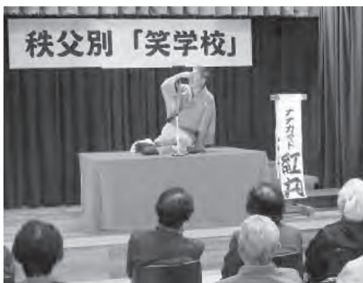
呼吸器を付けた入院中の母親が、洒落た会話を連発します

2名の噺家による古典落語や落語に入る前の「つかみの雑談」に会場は笑いでいっぱいとなりました。