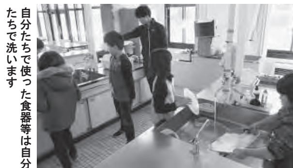
自分たちで使った食器等は自分たちで洗います