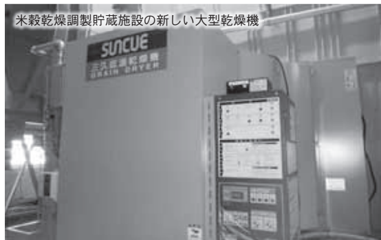
米穀乾燥調製貯蔵施設の新しい大型乾燥機

答 乾燥機は4基をすべて入れ替えました。粳摺り機は2基入れ替え1基増強し3基となり、色彩選別機は2基入れ替え1基増強し、120チャンネルを240チャンネルに機能強化しました。さらに荷受搬入、搬送ラインは2系統に増やしました。