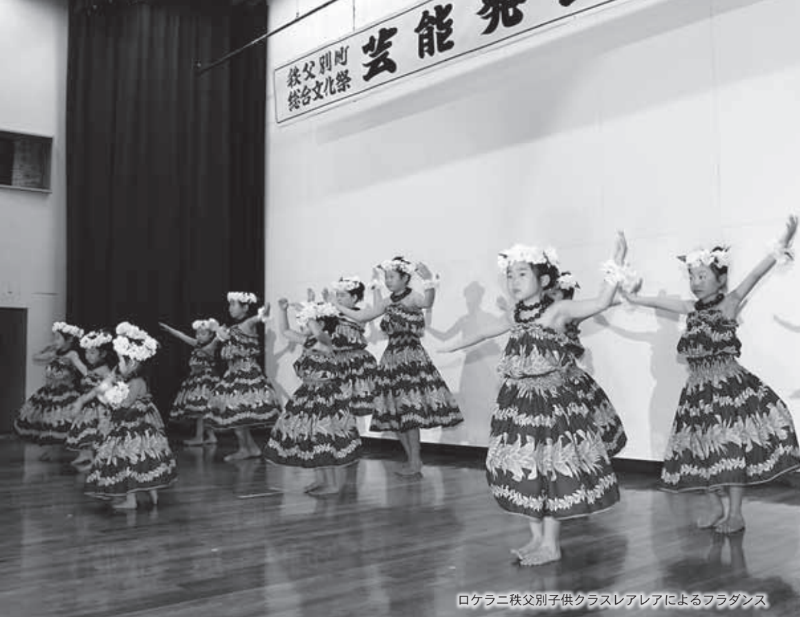
ロケラニ秩父別町子供クラスレアアによるフラダンス

発行/秩父別町議会 編集/町議会広報特別委員会 TEL/0164-33-2111 (議会事務局 内線25・26)