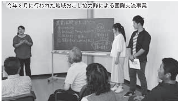
今年8月に行われた地域おこし協力隊による国際交流事業

す。報酬は国からの交付金で措置され、町では通信費・車両費・住宅費を補助しています。