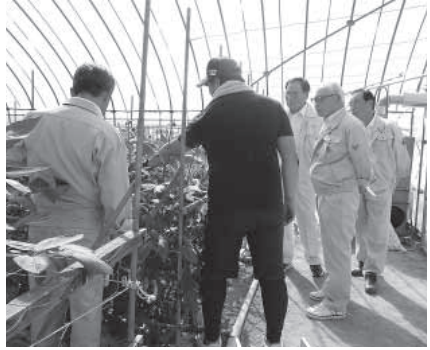
※着莢： ちやくえい 豆類が開花後にサヤをつけること

近年は、I・Uターンの後継者も増え、頼もしい限りであるが、こうした若い意欲のある農業者が安全で安心な作物を栽培し、安定した経営を確立・継続できるように、関係機関との連携を一層密にして、農業振興に努められるようお願いしたい。