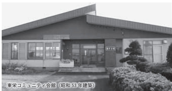
東栄コミュニティ会館（昭和53年建築）

財政負担を軽減、平準化していくよう要請し、本年3月に秩父別町公共施設等総合管理計画を策定したところであります。