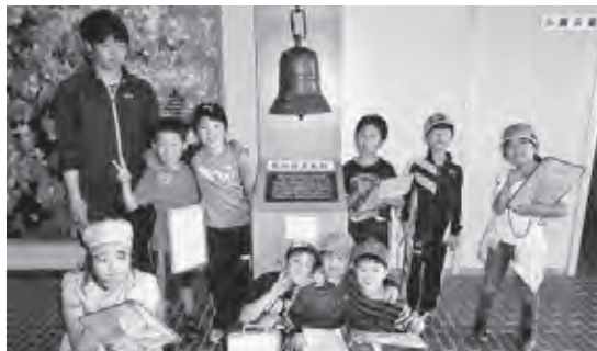
町指定文化財「屯田の鐘」 の前で記念撮影

児童たちは学習テキストを片手に、郷土館の収蔵品の実物を探索し、その使い方などをスタッフに確認しながら熱心に学習しました。