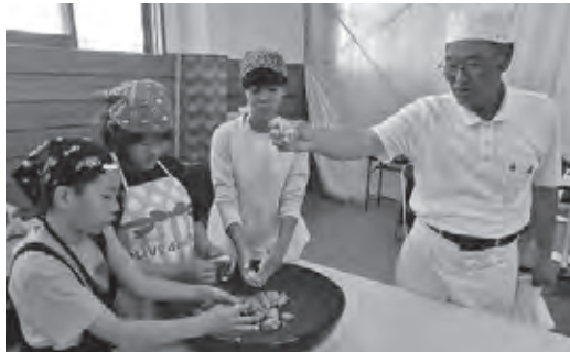
そば打ち体験の様子