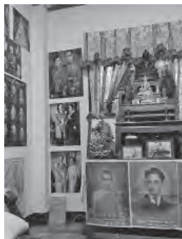
タイの祖母の家 ラーマ9世の肖像画など が飾られています

王様は最上位であり、特に以前の王（ラーマ9世）は非常に愛され、タイ人にとって、ラーマ9世は「父」の様な存在です。そのためタイでは、ラーマ9世のお誕生日である12月5日を父の日としています。日本にも父の日がありますが、タイでは日本よりも大きな行事として扱っていると思います。