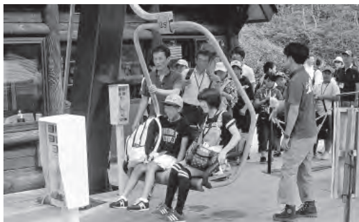
層雲峡黒岳では、リフトに乗りました