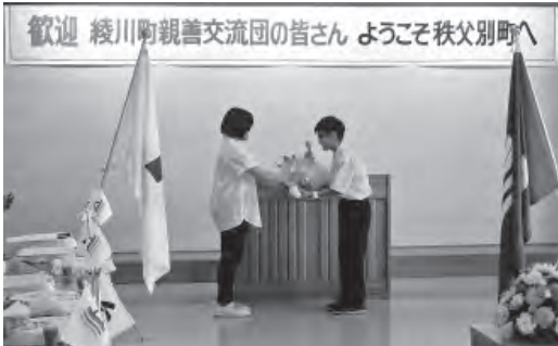
対面式で、秩父別町から綾川町へ花束贈呈

今回綾川町から来町された親善交流団は団長、副団長、中学生2名、小学生5名で、24日は歓迎式・交流会、25日は町内施設見学、そば打ち体験、焼肉パーティー、26日には大雪山層雲峡、アイスパビリオン、旭山動物園などに出向いて交流を深めました。