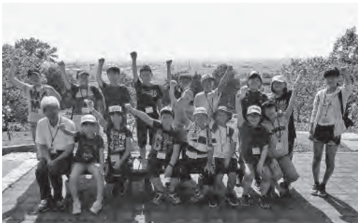
バラ園で記念撮影