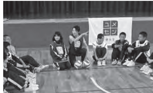
ミニゲームの作戦タイム中

始めに体育館でミニゲームを行い、生徒たちと交流を深めた後、会場を移し講演を行い、自分がどのように夢に向かってきたかを語っていただきました。