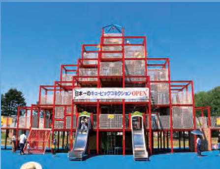
屋外遊戯場キュービック コネクションオープン (7月)