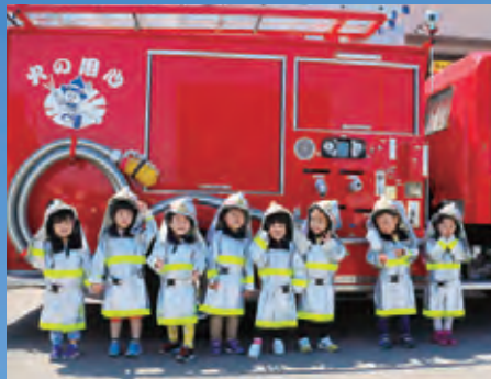
こども園くるみ 消防見学 (5月)