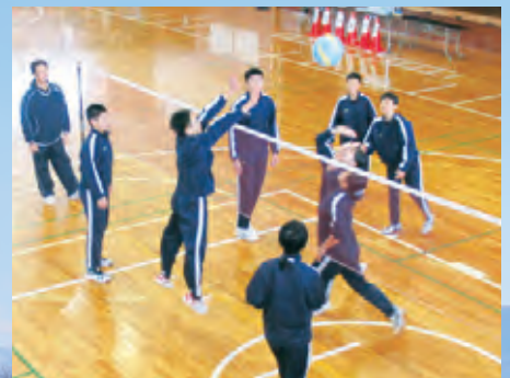
少年スポーツ大会 (12月)