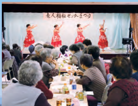
老人福祉センターまつり (11月)