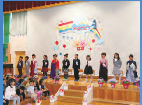
こども園くるみ卒園式 (3月)