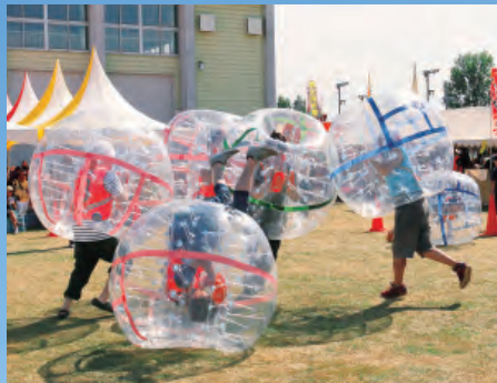
とんでんまつり (8月)