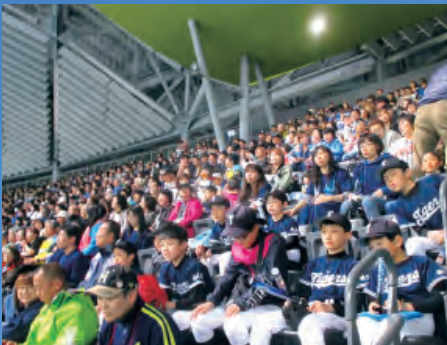
北海道日本ハムファイターズ 応援バスツアー (4月)