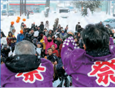
新春みかんまき (1月)