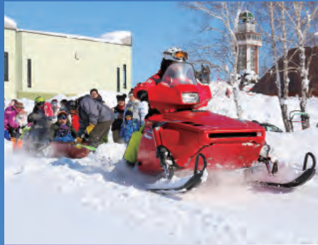
まちづくり協働隊 冬のイベント (2月)