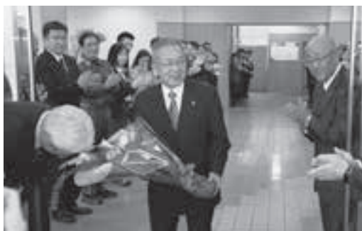
永い間お疲れさまでした（3月25日退庁）

皆様のご健勝とご多幸を心からご祈念申し上げます。略儀ながらもお礼と退任のご挨拶とさせていただきます。