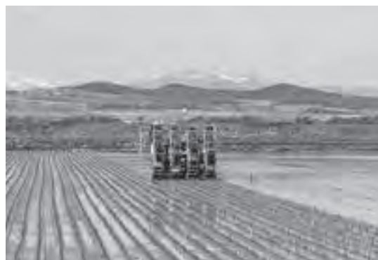
町内米農家にて田植え取材