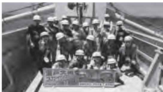
瀬戸大橋で記念撮影

今回綾川町へ派遣された親善交流団は団長、副団長、中学生4名、小学生3名で、23日の歓迎式・交流会からはじまり、24日はうどん打ち体験、綾川町施設見学、鮎つかみ取り体験、25日の香川県内施設見学等を行い交流を深めました。