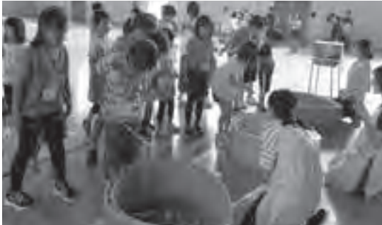
魚つりゲームの様子 うまく釣れるかな？

当日は48名のちっぷっ子たちが、魚釣りや輪投げ、ポイントゴルフなどのゲームや、子どもたちによる紙芝居などを楽しみました。