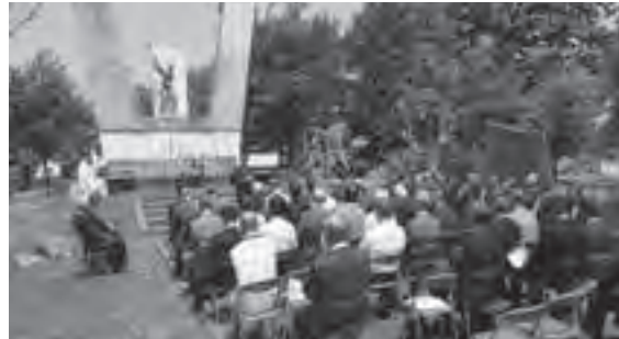
拓魂祭式典の様子

雨竜屯田会連絡協議会（秩父別・一已・納内屯田会）では、この地を拓いた屯田兵の偉業を称えるため、毎年この時期に拓魂祭を開催しています。