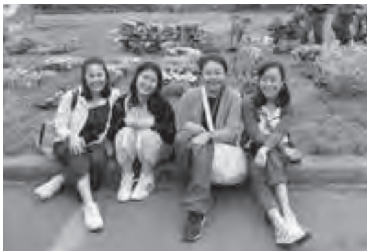
ローズガーデンで記念撮影

みんなに感想を聞いてみると、秩父別町のことを気に入って、来年もまた遊びにきたいと言っていました。