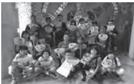
自分で作ったうちわを手に記念撮影