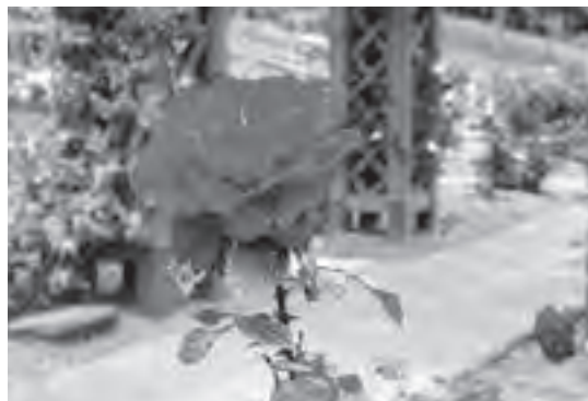
ローズガーデンのバラ