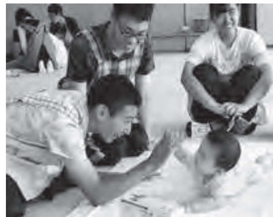
赤ちゃんハイタッチ？

当日は、生後6～7ヶ月の赤ちゃんとお母さん3組に協力をいただき、参加した生徒13名は、実際に赤ちゃんを抱っこしたり、お母さんから赤ちゃんを育てることの苦労と喜びを教わりました。