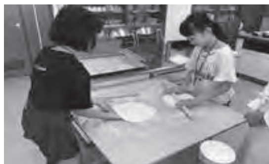
うどん打ち体験の様子