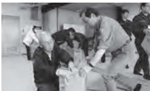
ダンボールベッド組立体験の様子

先進地の情報収集や道の指導も仰ぎ、準備を進めながら、町民の皆様が自主防災組織の必要性を感じていただけるよう、定期的に防災訓練を実施します。