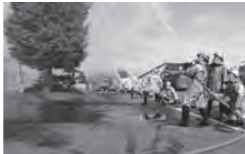
秩父別消防団設立110周年記念演習