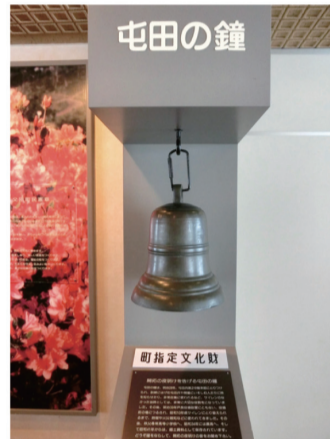
屯田の鐘(郷土館収蔵)

開拓当時、屯田兵に時を知らせた「屯田の鐘」の役目は、開基百年記念塔に設置された洋鐘が引き継ぎ、鐘のなるまち秩父別のシンボルとして、1日4回町民に鐘の音を響かせています。(6時、12時、18時、21時の計4回)