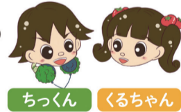
ちっくん くるちゃん