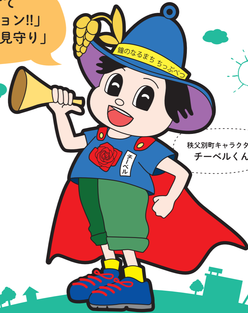
秩父別町キャラクター チーベルくん